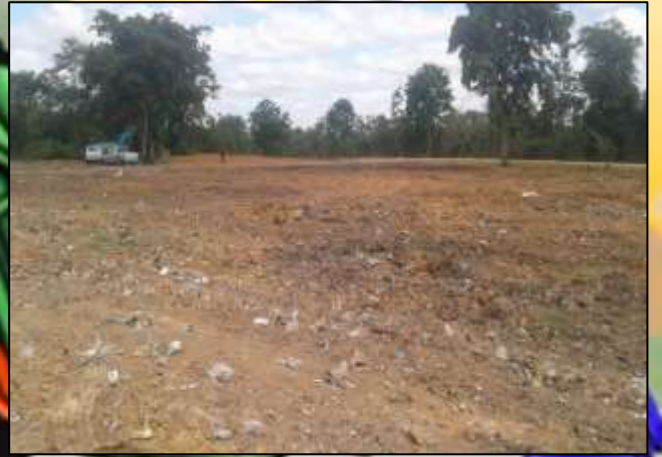
โครงการฝังกลบมูลฝอยบ่อทิ้งขยะ